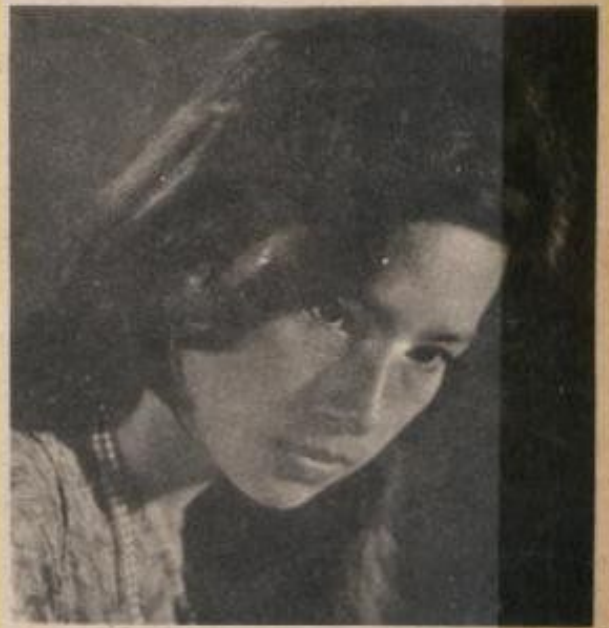
NỮ ca-sĩ GIANG THU