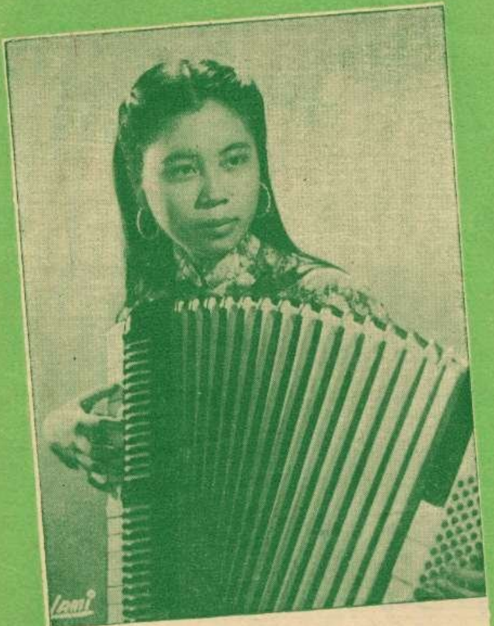
NỮ CA SỸ THÚY-NGA