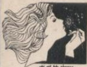
phát hành tháng 3-69