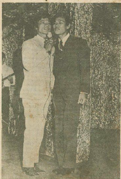
Đôi song ca LẠC ĐÃ