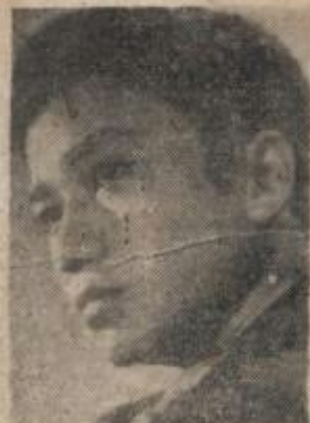
Ca sĩ XUÂN - XUÂN Giọng ca truyền cảm của miền Hậu-Giang