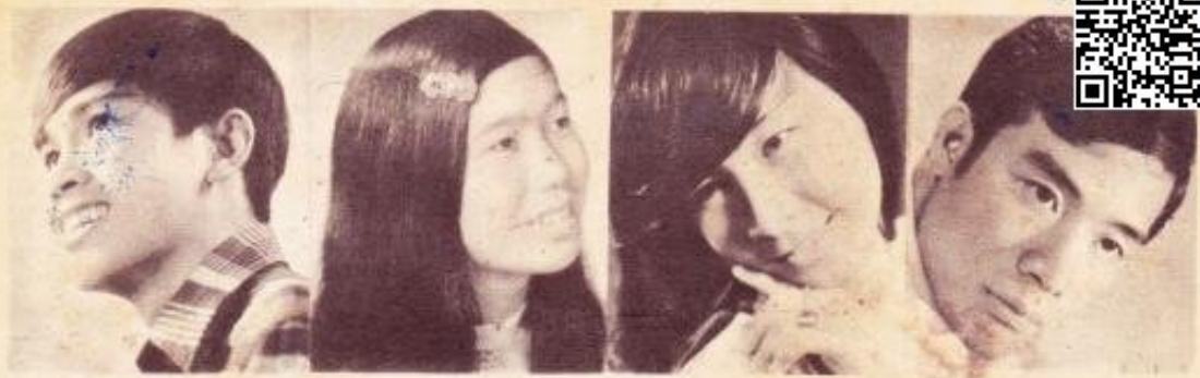
ĐÌNH TƯỜNG 644 Hưng Phú - Chợ Lớn