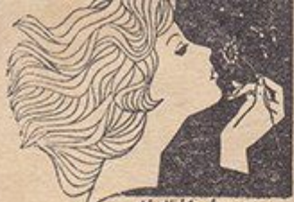
chị gái phương -