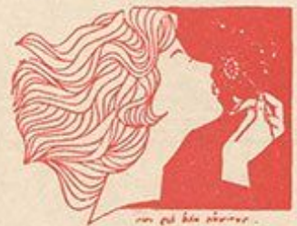
... và cả hồn thơ ...